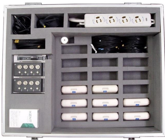
ノートパソコンの下