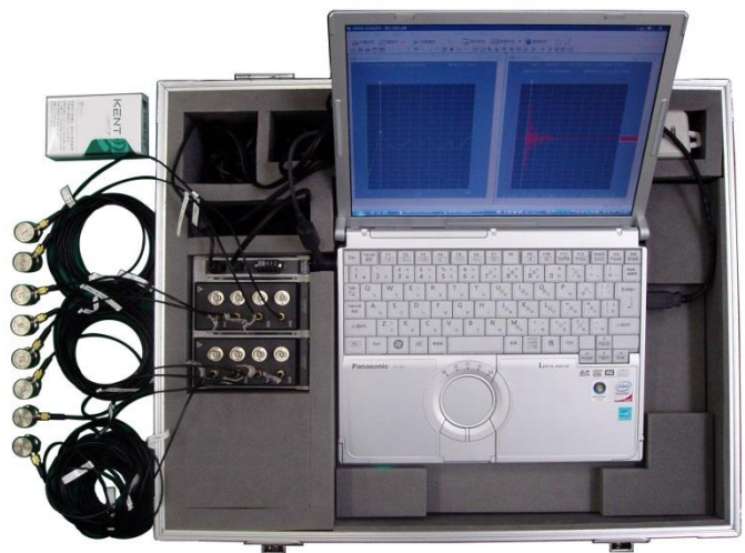
ピックアップの接続状態